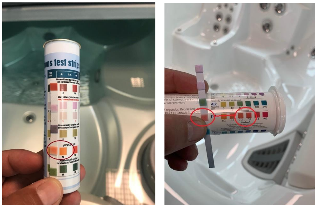
Slika 2. Očitanje pH vrijednosti ( ovisno o vrsti test trakica )

Nakon dodavanja Bayrol Spa Time pH- granula , izmjerite ponovo pH vode. Ukoliko je potrebno, ponovite postupak. Uzmite u obzir, da u nedavno napunjenom bazenu, pH vrijednost može rasti znatno brže nego u nešto "starijoj" vodi koja se koristi već neko vrijeme.