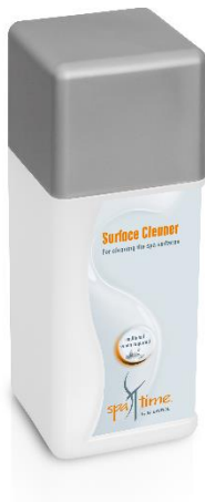
Slika 9. Bayrol Spa Time Surface cleaner