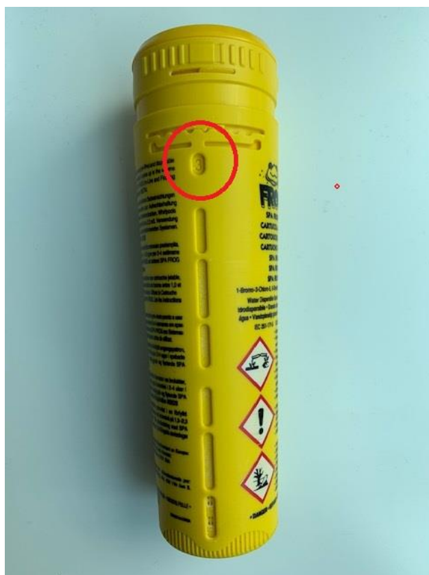
Slika 6. Spa Frog umetak podešen na 3

Okrenite gornji dio umetka dok Vam se na otvoru ne pokaže broj 3.