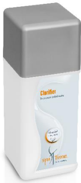
Slika 6. Bayrol Spa Time Clarifier

Nakon što se je voda razbistrila, izvadite filter bazena i operite ga pod mlazom vode.