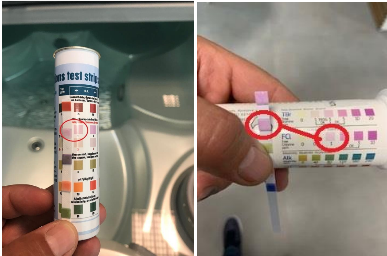
Slika 4. Očitavanje klora ( ovisno o vrsti trakica )

Uronite Test trakicu očitajte vrijednosti klora :