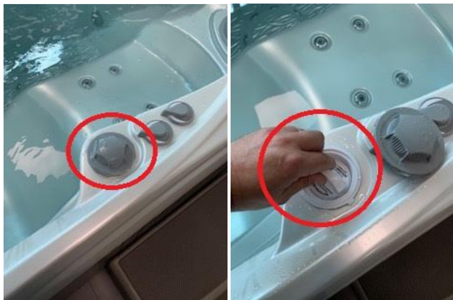
Slike 7 i 8. Otvaranje poklopca – pozicija poklopca ovisi o modelu Hot Spot bazena

Skinite poklopce na Vašem Hot Spot bazenu koji su namijenjeni za Spa Frog umetak. Prije skidanja poklopca, ugastite mlaznice i pumpu bazena.