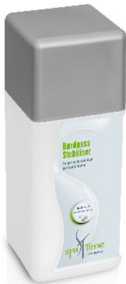
Slika 1. Bayrol Spa Time Hardness stabilizer