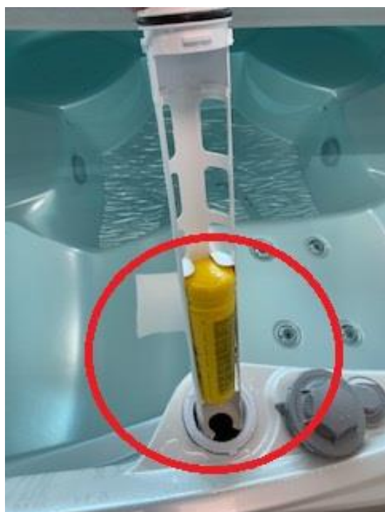
Slika 9. Pozicija Spa Frog umetka

Izvucite nosač umetka i postavite Spa Frog na donji dio nosača.