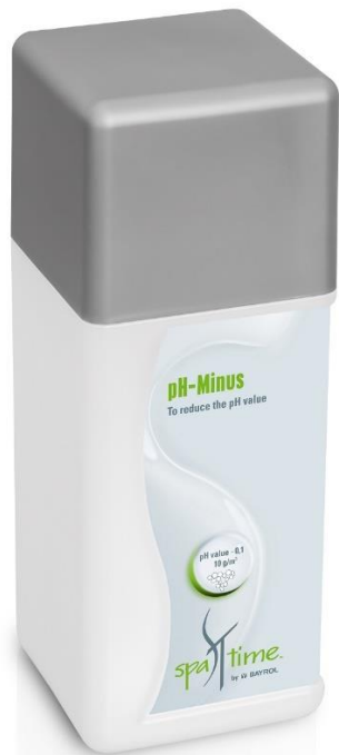
Slika 3. Bayrol Spa Time pH- granulat