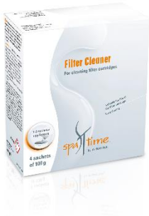
Slika 8. Bayrol Spa Time Filter cleaner

Sredstvo koje učinkovito skida masnoću i ostala zaprljanja s kartušnih filtera hidromasažnih bazena. Preporučljivo je filtere oprati svakih cca 30 dana.