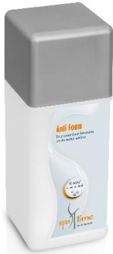
Slika 7. Bayrol Spa Time Anti Foam