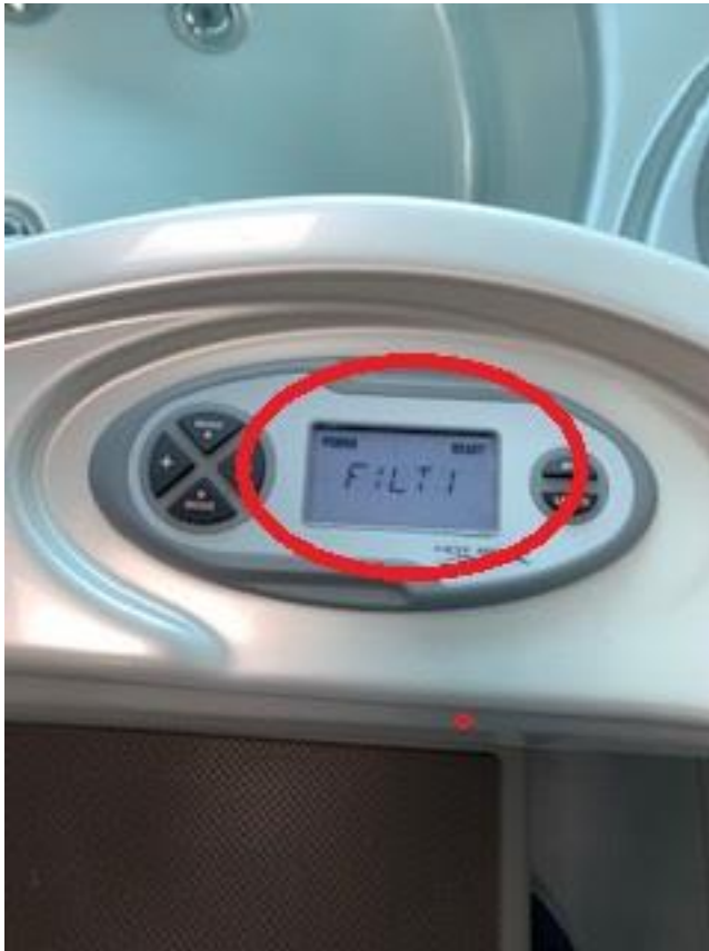
Slika 10. Postavljanje Filtracije bazena na minimalno 3 sata

Postavljanje Filtracije možete potražiti u Vašem Hot Spot priručniku.