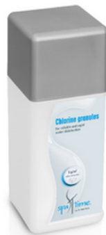
Slika 4. Bayrol Spa Time klor granule

Ponovo uronite test trakicu i očitajte vrijednosti klora .