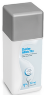
Slika 6. Bayrol Spa Time klor tablete

Tablete se postavljaju u prostor filtera, u vodu, ali se ne smiju postavljati na vidljivo mjesto kako ne bi bila na dohvat malim korisnicima bazena. Klor tableta može ostaviti obojeni trag na mjestu na kojem je bila odložena. Bez obzira na korištenje tablete klora, bitno je kontrolirati pH vrijednost vode. Tableta može trajati od 3-7 dana, ovisno o veličini bazena i stupnju korištenja. Ukoliko u bazenu nestane klora radi potpuno otopljene tablete, preporučuje se prvo dodati Bayrol Spa Time klor u granulama ( jedna čajna žličica ) te ponovo staviti tabletu.