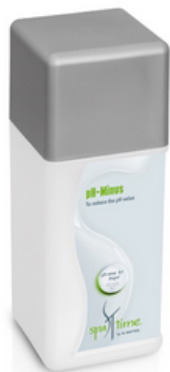
Slika 3. Bayrol Spa Time pH- granulat