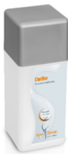
Slika 7. Bayrol Spa Time Clarifier