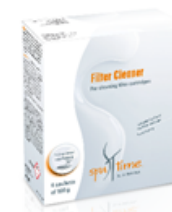
Slika 9. Bayrol Spa Time Filter cleaner